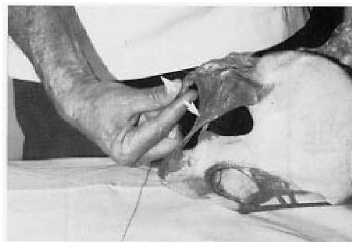
Fig. 1. Técnica osteopática. El operador introduce su índice en el recto y pinza el coxis entre el índice y el pulgar movilizándolo en extensión o en lateroflexión y rotación. Es también la técnica propuesta por J.B. Mennell.

La manipulación coccígea osteopática adoptada por Mennell (Fig. 1). Consiste en atrapar el coxis entre el pulgar y el índice y movilizar la articulación sacrococcígea, con movimientos de flexión y rotación para ¡restaurar la movilidad! Es la maniobra que usamos al inicio de nuestra práctica con algunos éxitos pero restringidos. En la práctica osteopática, esta maniobra se asocia siempre a manipulaciones lumbosacras o sacroilíacas.